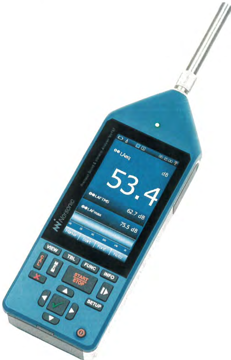
Abbildung 1: Schallpegelmesser Nor150 mit aufgesetztem Mikrophon